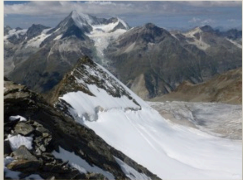
über Festi-Kin Lücke zur Domhütte